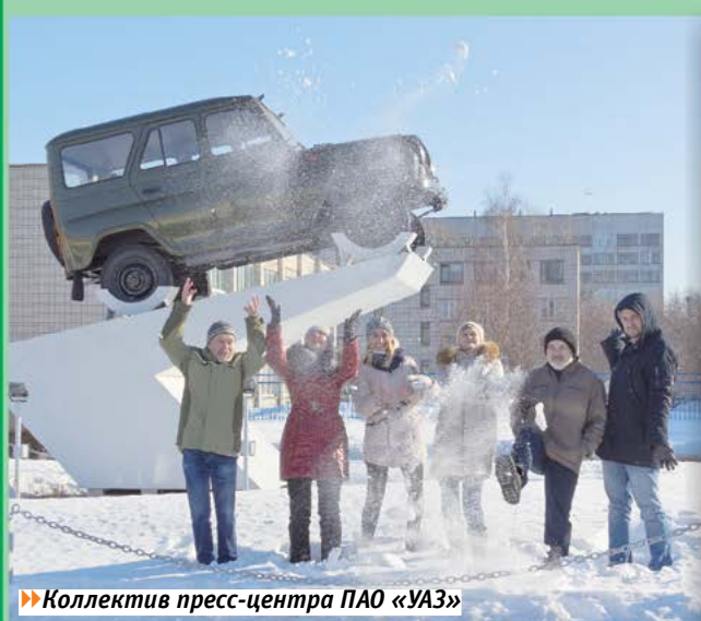
Коллектив пресс-центра ПАО «УАЗ»