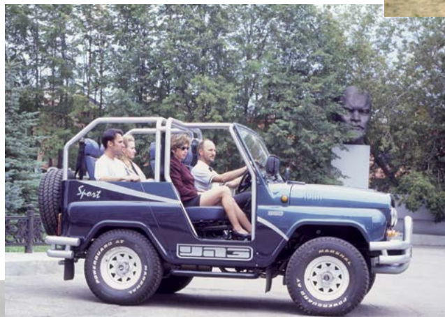
►►УАЗ-3150. Классическая версия автомобиля

Военную форму примерял на себя и короткобазный УАЗ-3150 «Шалун» . На него устанавливали турель с пулеметом или минометом. Кроме того, на армейской модификации дви-