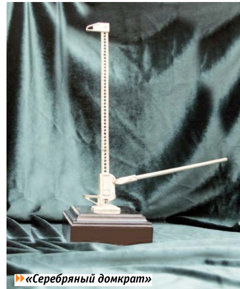
► «Серебряный домкрат»

гонки». Ребята с удовольствием выполняют задания экскурсовода и, соответственно, легче усваивают информацию.