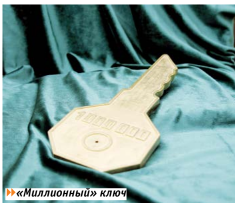
► «Миллионный» ключ

Нашел свое место на музейной полке «Серебряный домкрат» – высшая награда Европейского салона-конкурса автомобилей-вездеходов, проходившего в итальянском городе Сан-Ремо в 1978 году, являющийся признанием вклада УАЗа в мировое автомобилестроение. Прекрасно себя чувствует в центре зала настоящий автомобиль «ГАЗ-69А», «Аннушка», 500-тысячный со дня основания завода. Привлекают посетителей коллекции моделей автомобилей «ЗИС», «ГАЗ», «УАЗ», напоминающие о предприятиях – наших «старших братьях», а также коллекции всевозможных значков, посвященных данным заводам. Остался в музее ключ, выпущенный в ознаменование схода с конвейера миллионного автомобиля «УАЗ».