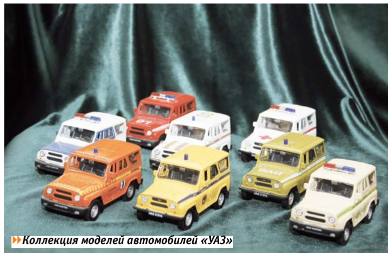
► Коллекция моделей автомобилей «УАЗ»

трудовой славы УАЗ успешно прошел паспортизацию и был зарегистрирован департаментом культуры и архивных дел Ульяновской области под номером 36 как негосударственный музей, а более 3,5 тысячи его экспонатов вошли в Единый реестр музейных фондов РФ.