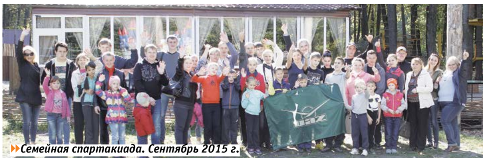
► Семейная спартакиада. Сентябрь 2015 г.

Темой, объединившей всех собравшихся представителей малого и крупного бизнеса, стала ответственность предприятий перед своими сотрудниками, обществом и страной в целом. Так, Ульяновский автомобильный завод представил свою корпоративную программу работы с персоналом.