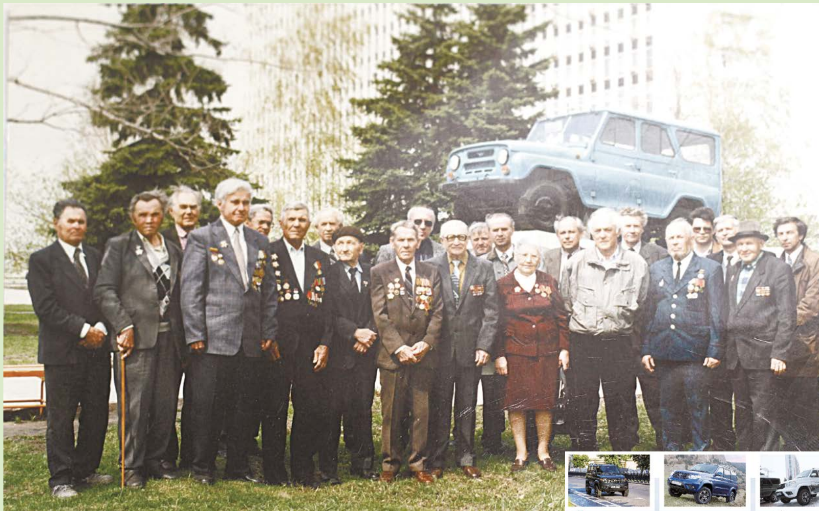
▶ Ветераны управления главного конструктора. Начало 2000-х годов.