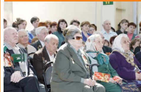
Слава героям Великой Отечественной войны!

От всей души желаю всем доброго здоровья, радости, тепла и заботы близких! Мира и счастья вам и вашим семьям!