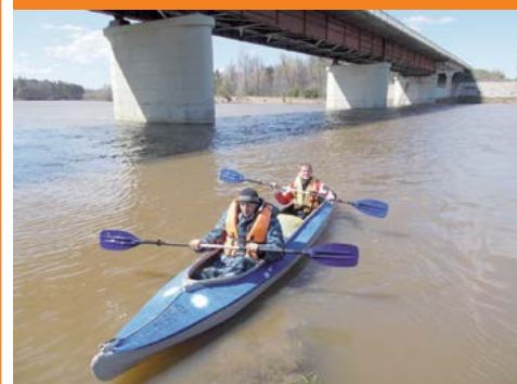
Туристический сезон-2016 открыт