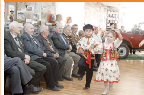
Диалог двух поколений