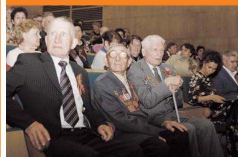
Торжественный концерт ко Дню Победы