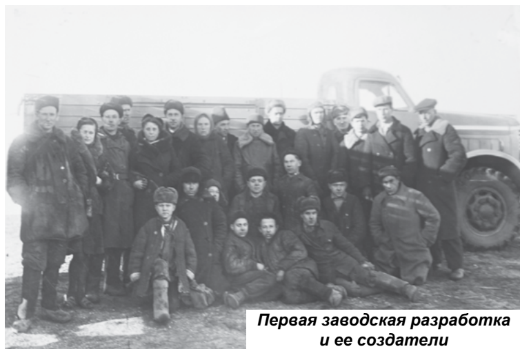
Первая заводская разработка и ее создатели

построят новый объект и будут выпускать продукцию». Тогда же было предложено организовать производство дизельного грузовика УАЗ-253.