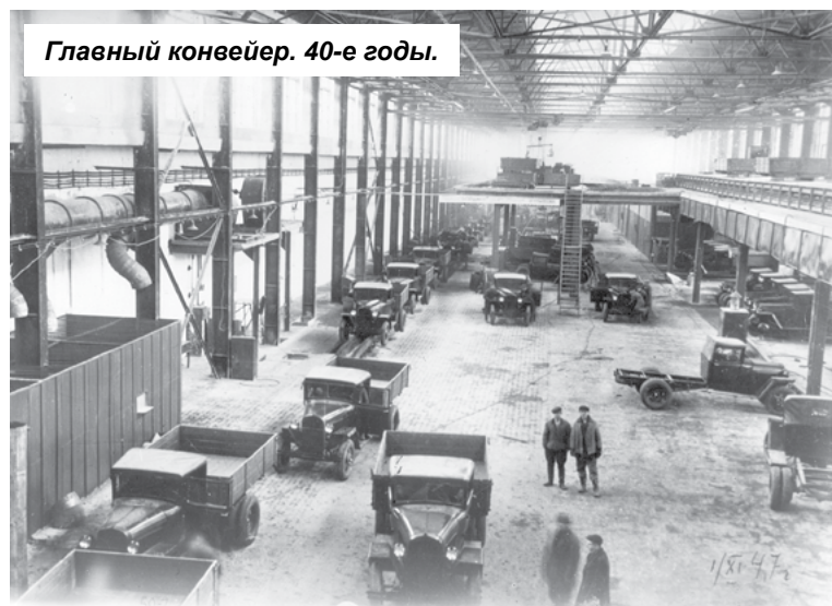
Главный конвейер. 40-е годы.

3 марта начали готовить котлован под фундамент будущей электроцентрали. В руках у рабочих лопаты, ломы, кувалды, тачки – и опять все равны. Люди