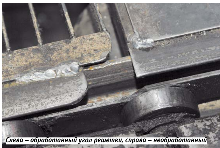
Слева – обработанный угол решетки, справа – необработанный

ный пост. Кайдзен-предложение направлено на улучшение качества нашей продукции и повышение производительности работы операторов.