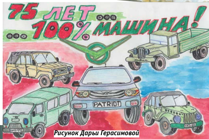
Рисунок Дарьи Герасимовой

«Все мои родные работают на заводе: бабушка, дедушка, мама и папа, крестный. В свой рисунок я вкладывала всю душу, я хотела нарисовать автомобиль очень красивым, похожим на ори-