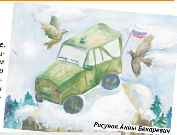
Рисунок Анны Бекаревич

те, творите, всегда стремитесь к новым достижениям и смело реализовывайте ваши идеи и задумки», – присоединился к поздравлениям