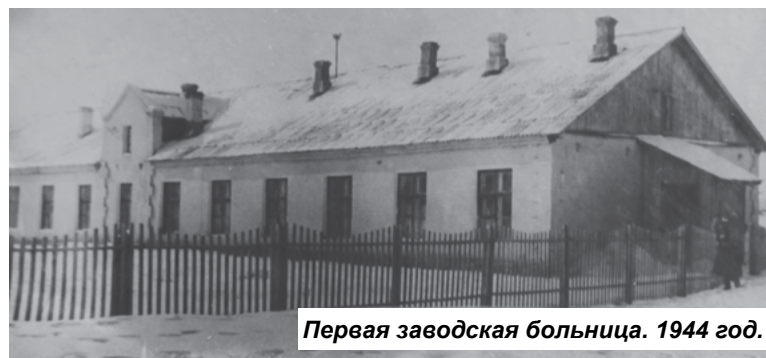
Первая заводская больница. 1944 год.

Основные задачи на 1946 год: к 1 декабря пустить ТЭЦ 1-й очереди, организовать механообработку агрегатов шасси и коробки передач, сборку кабин и платформ на мощность 100 машин, закончить монтаж оборудования и начать сборку автомобилей на главном конвейере.