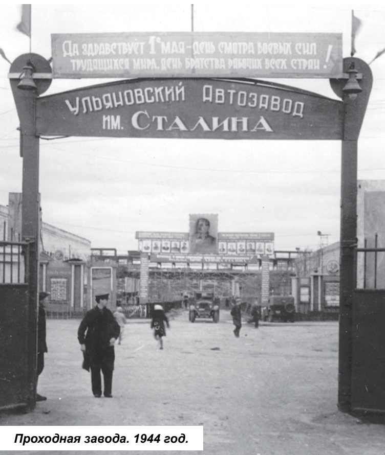
Проходная завода. 1944 год.

Май. ПОБЕДА! Прошел первый митинг, впервые за эти тяжелые годы, посвященный великому счастливому поводу – Победе. Автомобили, боеприпасы, малолитражные двигатели – самоотверженный вклад завода в общую победу. Этот день приближали как на фронте, так и в тылу. Автозаводцы делали миниатюрные зажигалки, хирургическое оборудование, собирали теплые вещи и отправляли на фронт и в госпитали.