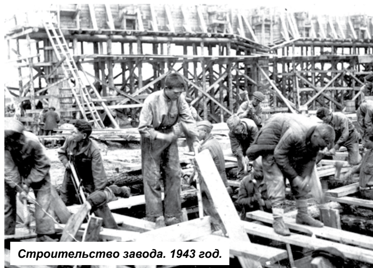
Строительство завода. 1943 год.