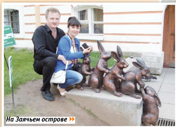
«На Заячьем острове»