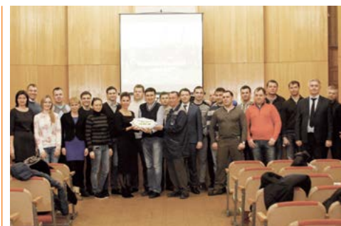
УАЗ собрал в Ульяновске представителей дилерских центров