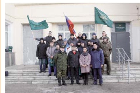
День призывника на Ульяновском автозаводе