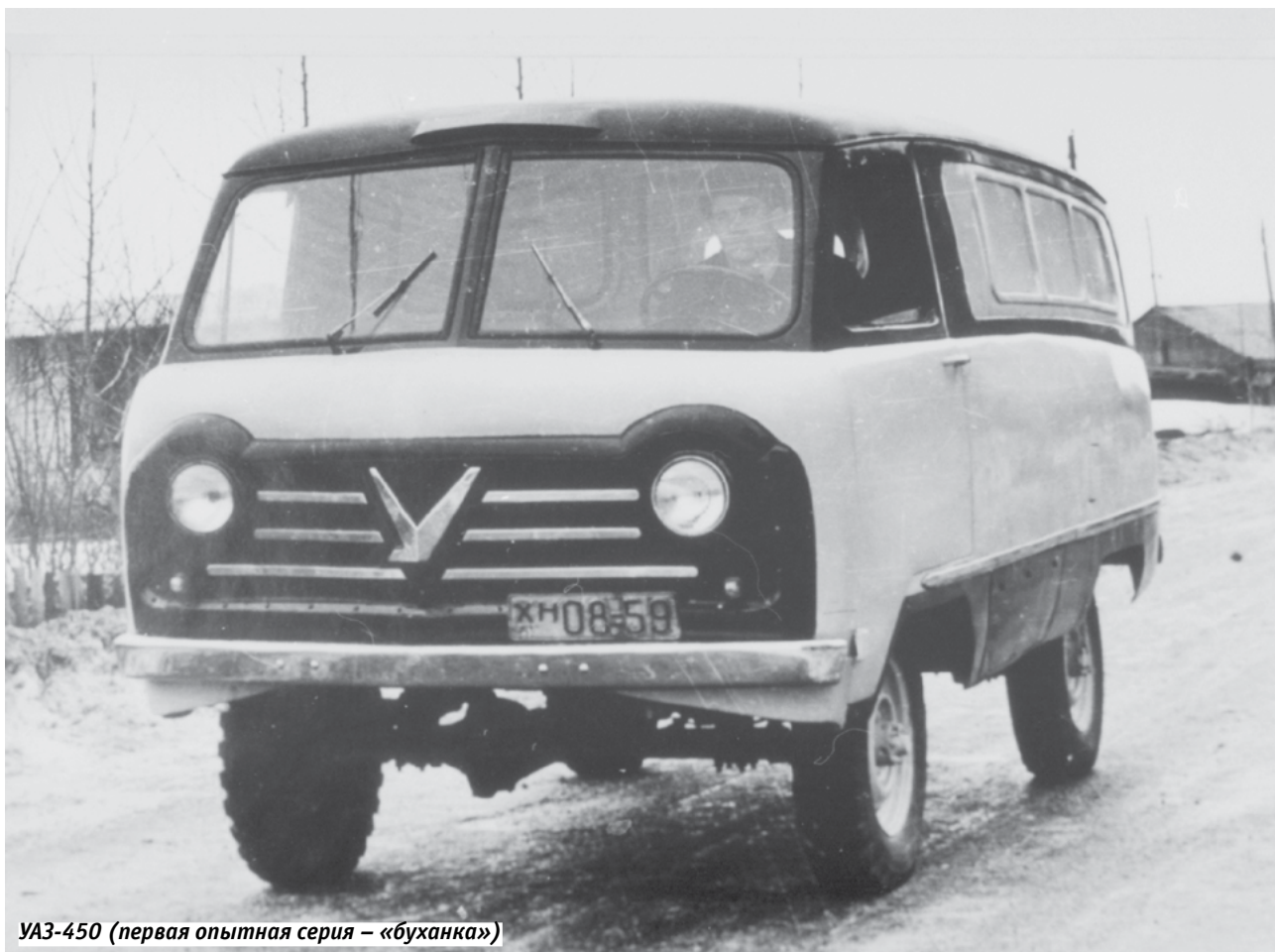
УАЗ-450 (первая опытная серия – «буханка»)

Однажды (в конце августа 2013 года) я оказался в заводском музее, где присутствовали автолюбители – поклонники УАЗов из Германии, которые допытывались у меня, почему наши фургоны так называются. По-видимому, это название прилипло и к серийным авто-