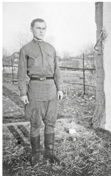
► Август 1945 года