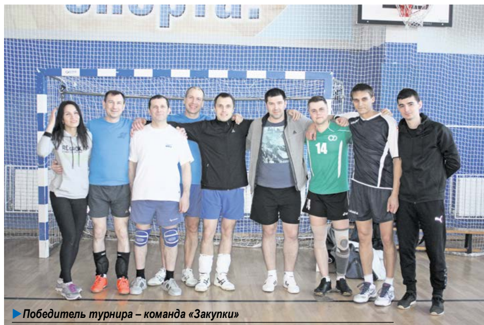
► Победитель турнира – команда «Закупки»

Напряженная борьба разгорелась среди мужских сборных. Победителем турнира