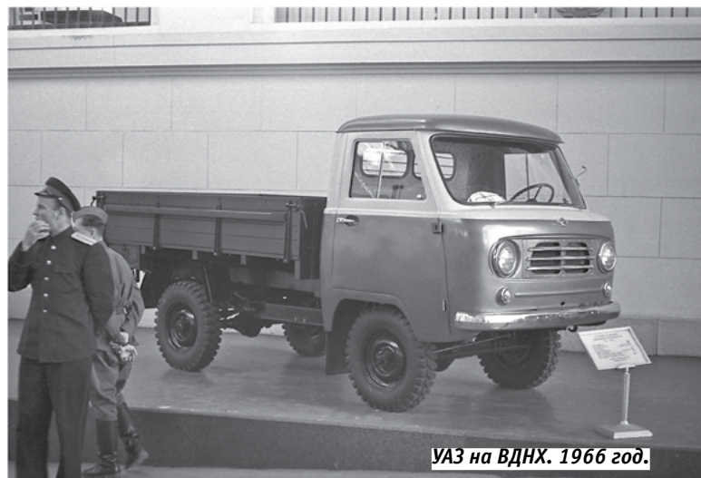
УАЗ на ВДНХ. 1966 год.