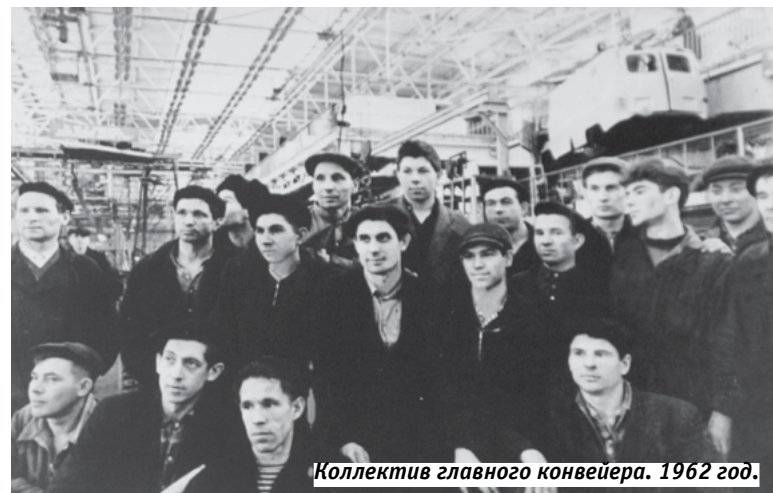
Коллектив главного конвейера. 1962 год.