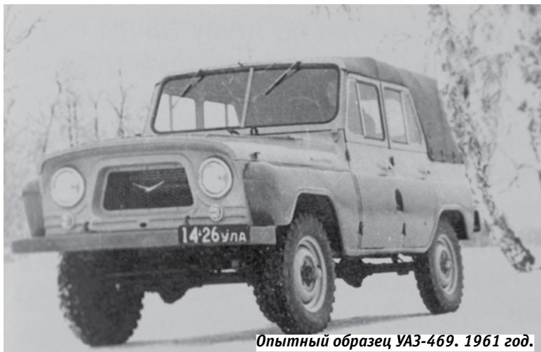
Опытный образец УАЗ-469. 1961 год.

Решением Совета Министров РСФСР было санкционировано строительство главного конвейера на УАЗ. Первым этапом стало оснащение системой толкающих конвейеров одного из участков на окраске мостов в электростатическом поле. Изготовление уз-