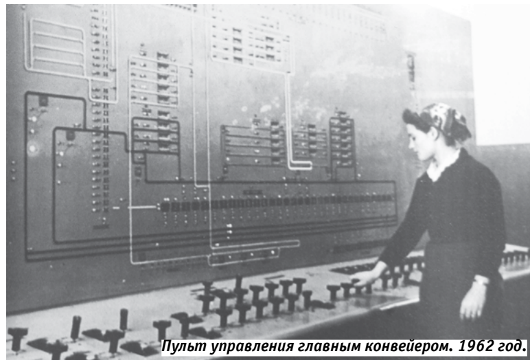
Пульт управления главным конвейером. 1962 год.