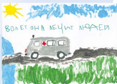
▶ Гришина Алиса

После просмотра каждый юный художник получил грамоту за участие и подарок. В завершении официальной части гости получили возможность ознакомиться с автомобильной выставкой модельного