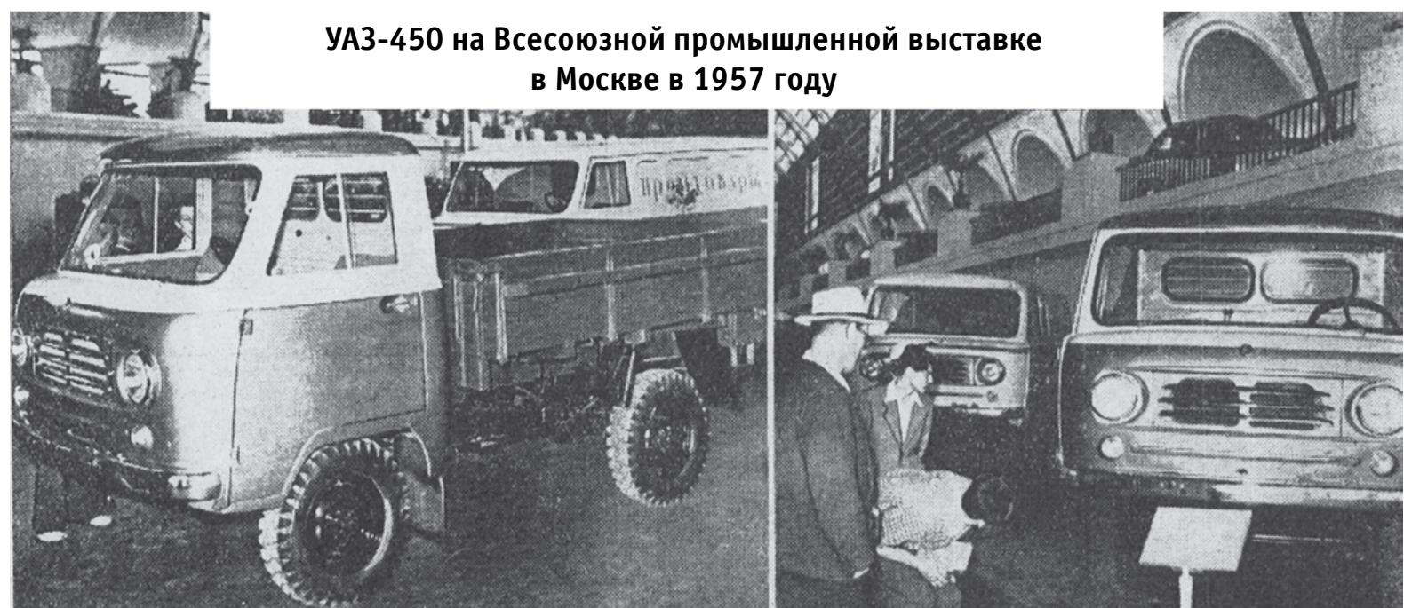
УАЗ-450 на Всесоюзной промышленной выставке в Москве в 1957 году

станки! Тогда у нас вместо этого оборудования были огромные деревянные «болваны». На них накладывался лист железа, а на его края прикрепляли гири, чтобы углы металлического полотно хоть немного обвисли и заготовка по возможности при-