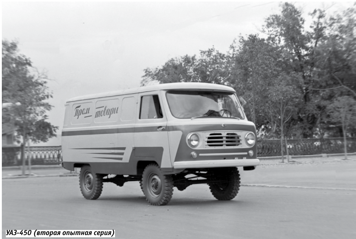
УАЗ-450 (вторая опытная серия)