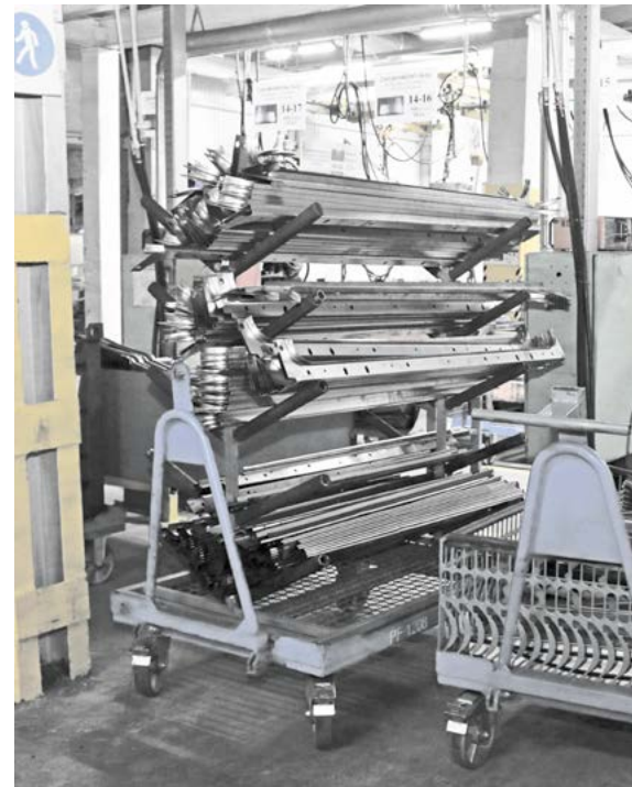
► Пример внедренного улучшения: модернизированная тележка заменила собой сразу несколько бункеров и шаланд