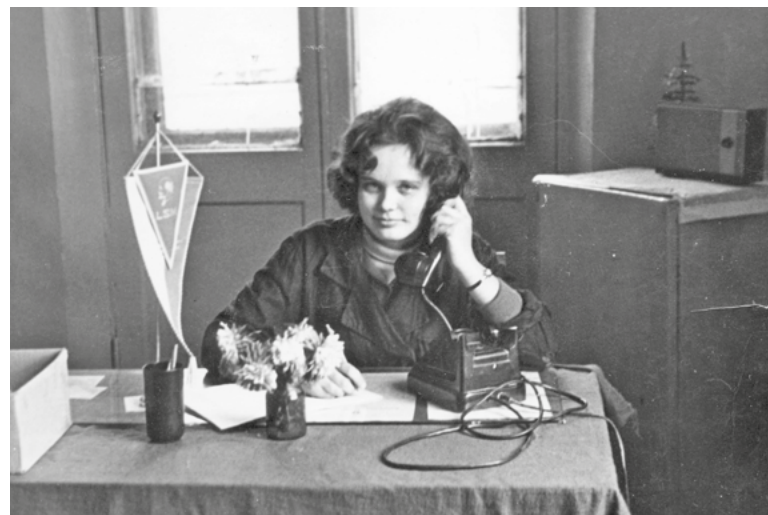
► Начало 80-х. На комсомольской работе