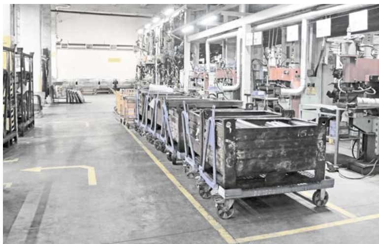
► Участок сварки грузового отсека после оптимизации. За счет изменения логистических потоков и установки бункеров на тележки, пространство стало свободнее и безопаснее для перемещений