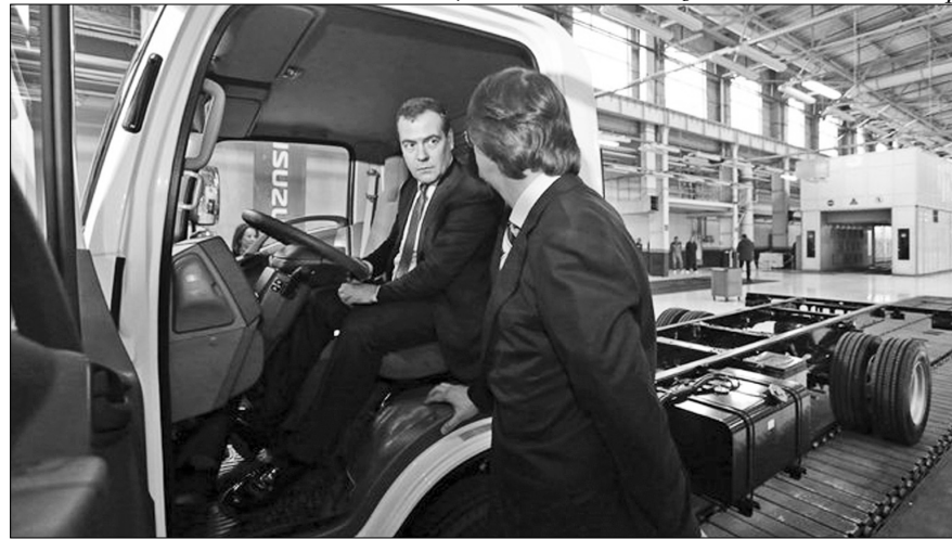
ключевой показатель эффективности вложенных инвестиций и совместных усилий.

Всего в 2014 году на предприятии планируется выпустить 2544 автомобиля, в том числе 2340 шасси серии ELF и 204 шасси серии FORWARD.