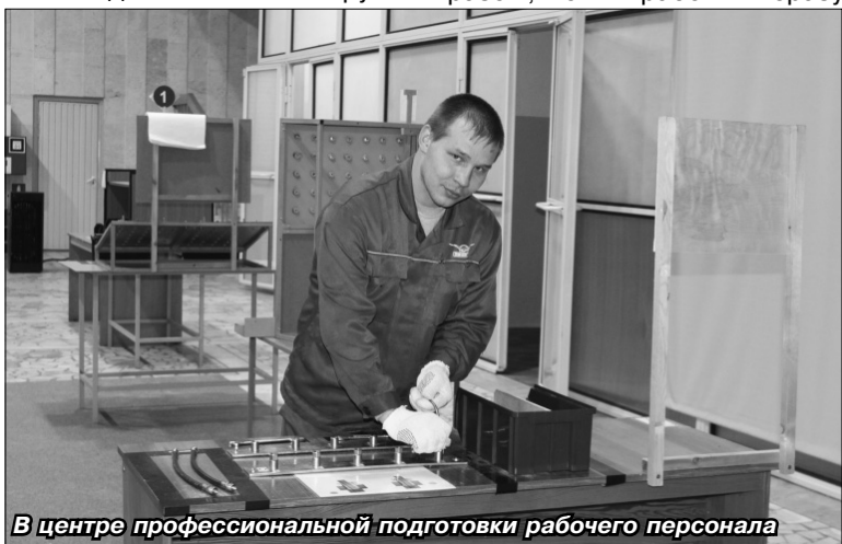
В центре профессиональной подготовки рабочего персонала

- Не секрет, что предприятию нуждается в обновлении кадров. В прошлом году