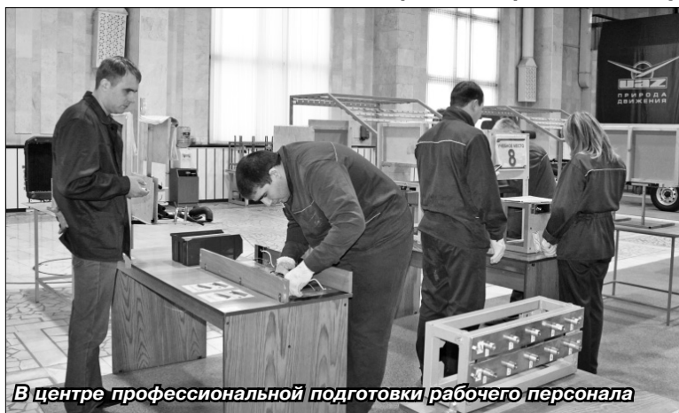
В центре профессиональной подготовки рабочего персонала

Мы продолжаем работать и над совершенствованием уже существующих наших про-