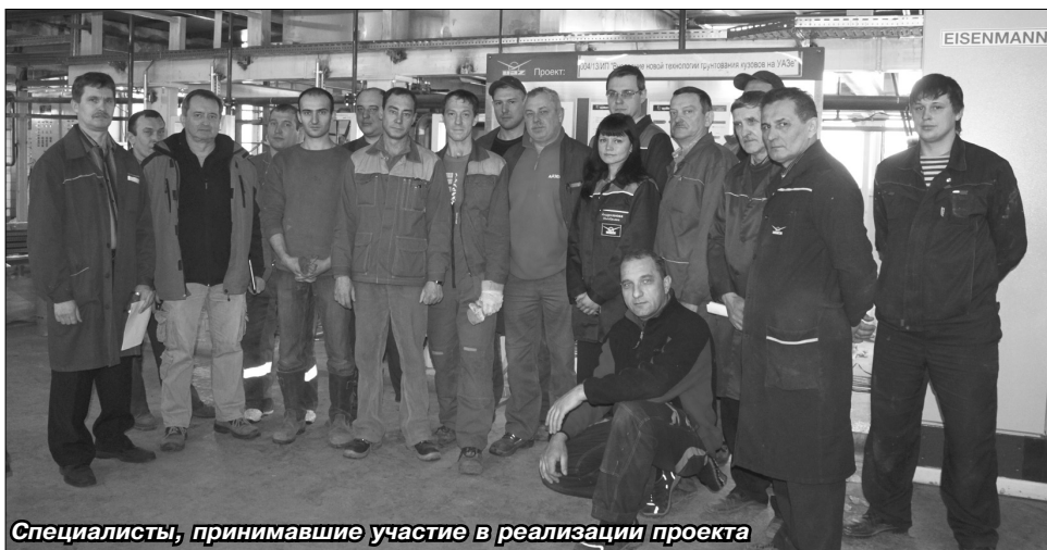
Специалисты, принимавшие участие в реализации проекта

На 2014 год запланирована реализация еще нескольких проектов, позволяющих повысить эффективность производства и качество продукции.