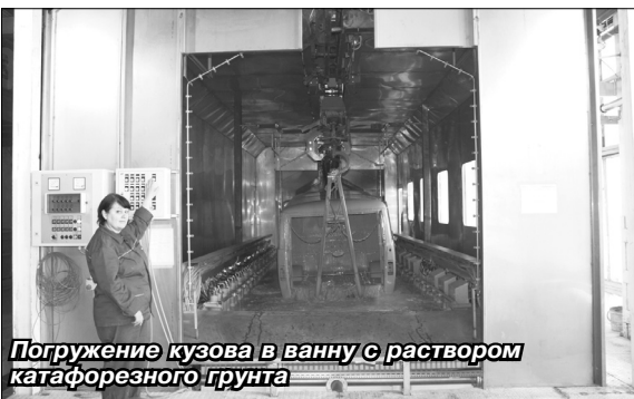
Погружение кузова в ванну с раствором катафорезного грунта

Реализации проекта предшествовала большая подготовительная работа. Предварительно были рассмотрены и тщательно проработаны три варианта размещения катафорезной части цеха окраски кузовов: рядом с окрасочным комплексом «Айзенманн», на первом этаже корпуса ПМК-2, на четвертом этаже корпуса ПМК-2. В конечном счете был