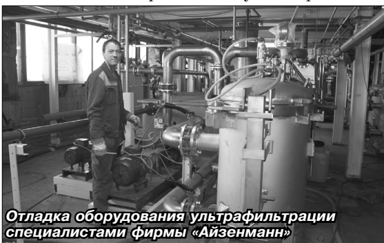
Отладка оборудования ультрафильтрации специалистами фирмы «Айзенманн»

химической промывки ванны катафорезного грунта и ее заполнения. 26 января началась отладка производства, а 31-го мы уже загрузили первый кузов.