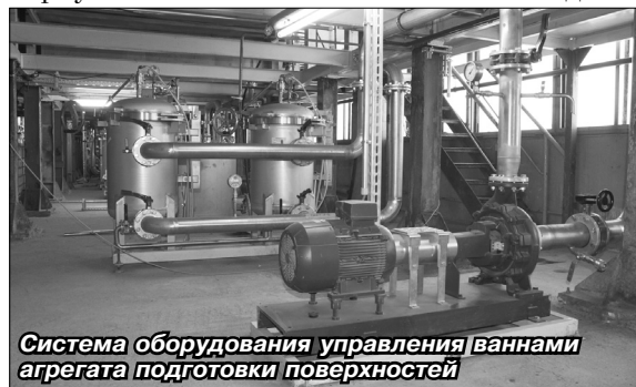
Система оборудования управления ваннами агрегата подготовки поверхностей

В октябре начались поставка и поэтапный монтаж не-