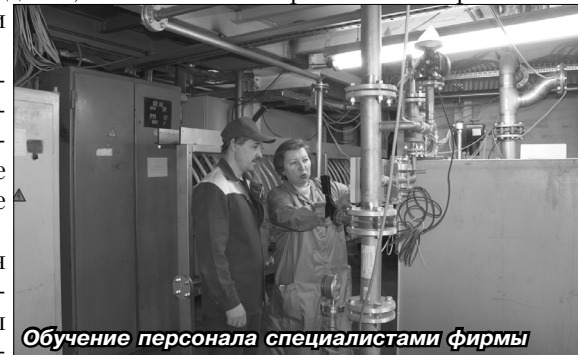
Обучение персонала специалистами фирмы

реализован еще один проект по переходу на новую технологию - сухое шлифование на чистовом участке окраски грузового кузова, что позволит улучшить качество и снизить трудоемкость и энергоемкость процесса. Согласно проекту были смонтированы приточно-вытяжная вентиляция, установлены новое освещение, системы подачи сжатого воздуха, потолочные и напольные фильтры, исключены из процесса сушильные камеры влажного кузова.