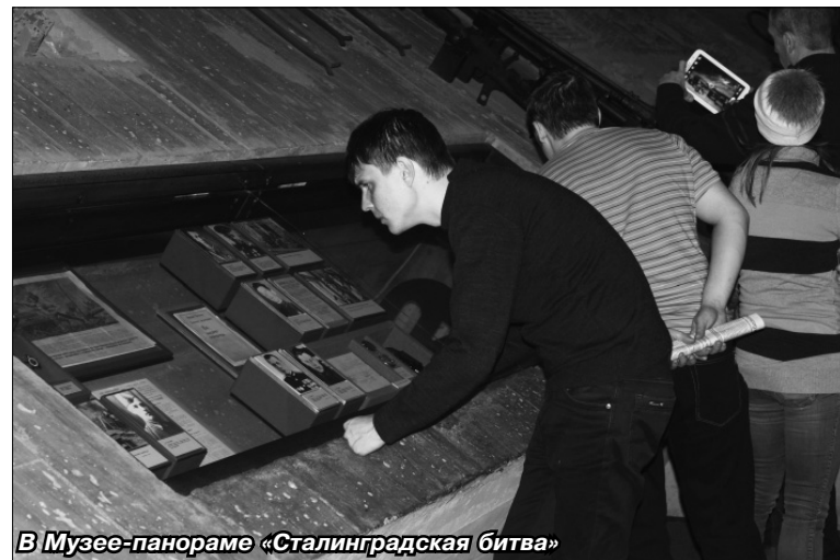
В Музее-панораме «Сталинградская битва»

«Железный ветер бил им в лицо, а они все шли вперед, и снова чувство суеверного страха охватывало противника: люди ли шли в атаку, смертны ли они?!» - гласит надпись на площади Героев, куда вывела