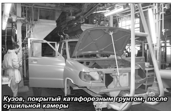
Кузов, покрытый катафорезным грунтом, после сушильной камеры

Непосредственная реализация проекта началась в марте 2013 года, когда приступили к проектированию и изготовлению оборудования с учетом требований УАЗа. В процессе деятельности шла и доработка проекта. Например, первоначально планировалась частичная замена агрегата подготовки поверхностей, но затем мы пришли к тому, что его необходимо заменить полностью. Таким образом, была введена новая стадия,