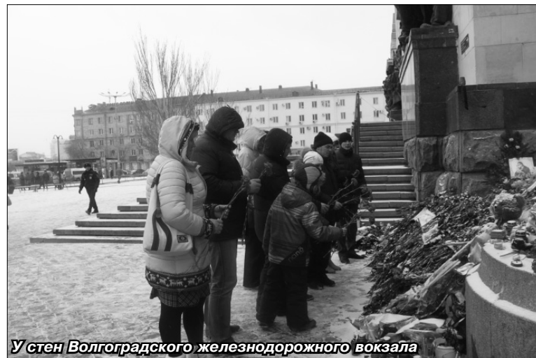
У стен Волгоградского железнодорожного вокзала

К сожалению, суровое настоящее бывает не менее страшным, чем кровавые страницы далекой войны. Сегодня все так же гибнут на улицах великого города мирные люди, дети. За несколько недель до поездки заводской молодежи, накануне новогодних праздников, страшное слово «трагедия» облетело всю страну. Сразу два взрыва прогремели в Волгограде, погибли десятки людей. Автозаводчане не смогли пройти мимо этой трагедии, решив отступить от обычных туристических маршрутов и почтить память погибших в этой необъявленной войне. Ребята отправились к Волгоградскому железнодорожному вокзалу, в стенах которого и