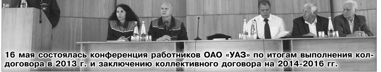
16 мая состоялась конференция работников ОАО «УАЗ» по итогам выполнения колдоговора в 2013 г. и заключению коллективного договора на 2014-2016 гг.

о модернизации производства и продуктовой линейки «УАЗ». С 1 октября 2014 г. будет запущен новый автомобиль «УАЗ-Патриот» 2014 года, который, по прогнозам, позволит повысить продажи на 25%. Именно такая цель обозначена в финансовом плане 2015 г.