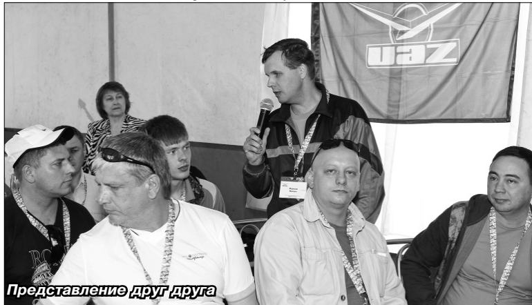
Представление друг друга

рассказал заводским руководителям о ситуации на рынке продаж автомобилей, его перспективах. Стагнация производства, падение спроса, кризис продаж - такими словами охарактеризовал он состояние авторынка.