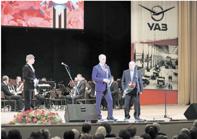
► На праздновании 60-летия Совета ветеранов УАЗ

«Конечно, возраст дает о себе знать. Проявляются болячки, но о них не хочется думать. У нас есть много отдушин, у каждого своя, у меня, например, – семья и садоводство, они дают мне заряд бодрости и положительные эмоции, а чем их больше, тем лучше. А вот эта, общая наша работа в Совете ветеранов – это инструмент повышения качества жизни старшего поколения. Это дает нам возможность жить, думать, и строить