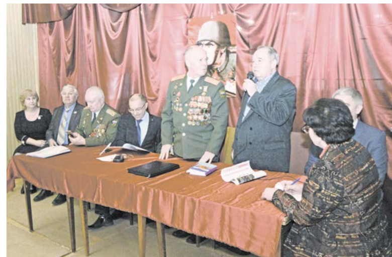
► Выступление на собрании ветеранов в ДК УАЗ