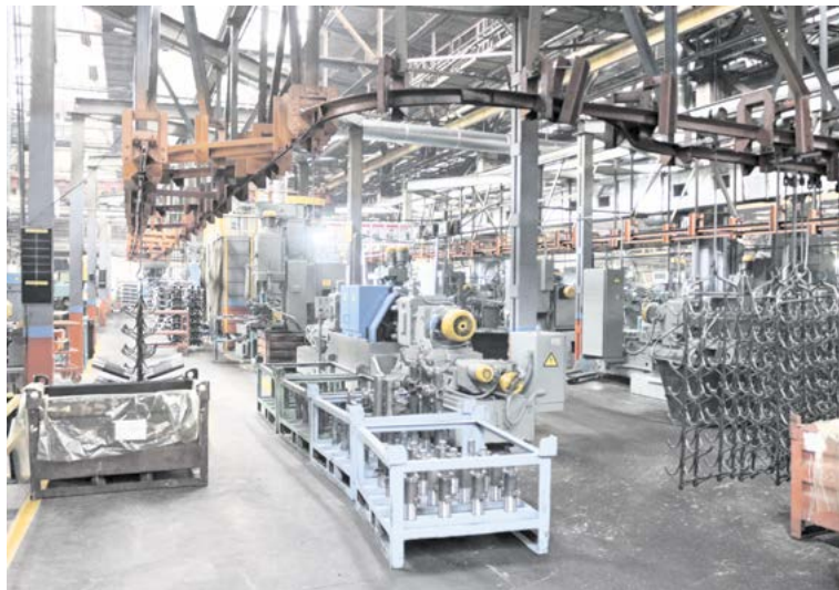
► Общий вид участка после внедренных изменений. За счет демонтажа неиспользуемых конструкций, пересмотра системы складирования и изменения логистических потоков пространство стало свободнее и безопаснее для перемещений.

На рабочих местах сварщиков и операторов отсутствовала необходимая техническая документация (карты стандартизованных работ (КСР), карты конт-