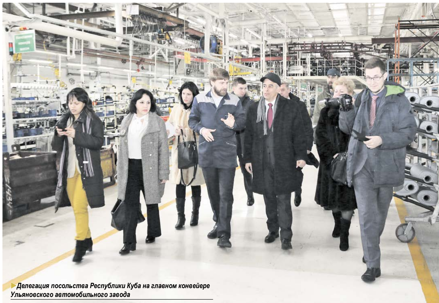
► Делегация посольства Республики Куба на главном конвейере Ульяновского автомобильного завода

Внедорожники УАЗ ПАТРИОТ и ПИКАП, легкий грузовик УАЗ ПРОФИ успешно прошли испытания в Институте транспорта Кубы. Это позволяет компании УАЗ наладить серийные поставки автомобилей современного модельного ряда на Кубу для реализации совместных российско-кубинских проектов. Вопросы серийных поставок обсуждались 1 марта в ходе визита чрезвычайного и полномочного посла Республики Куба в РФ господина Херардо Пеньяльвера Порталья на Ульяновский автомобильный завод.