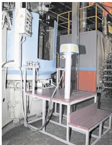
► Возле агрегатного станка размещена единая загрузочная эстакада, на которой установлен кондуктор с защитным кожухом для зачистки деталей и металлические фиксаторы для складирования оснастки и вспомогательного инструмента.

Основные мероприятия по оптимизации работы участка прошли в январе 2019 года. Рабочей группой было внедрено 163 крупных и 6 мелких улуч-