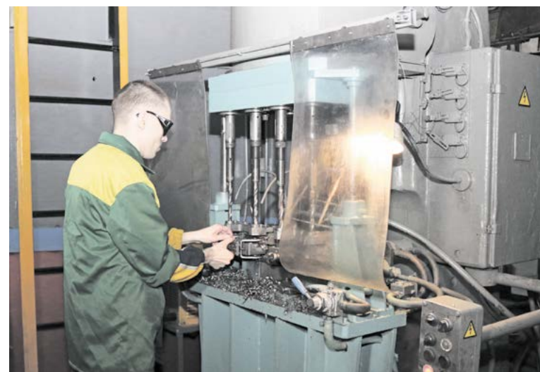
► Для сверлильного станка изготовлены и внедрены прозрачные раздвижные защитные шторы.

на разметка проездов, проходов и размещения адресного хранения транспортировочной тары с комплектующими. Произведена покраска 27 единиц оборудования.