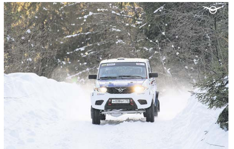
► УАЗ Пикап под управлением В. Проненко и Д. Агафонова на трассе бахи «Северный лес»