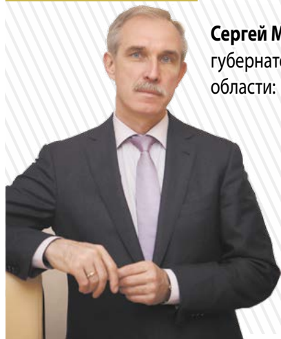
Сергей Морозов, губернатор Ульяновской области:

«Мы создаем национальный центр автомобилестроения. Здесь реализуется проект «Исузу» по сборке грузовиков различной тоннажности. Совсем скоро начнется строительство нового завода по проекту «Исузу-Соллерс». Еще один немаловажный момент – развитие кооперации малого и среднего инновационного бизнеса. Учитывая то, что сюда придут новые резиденты, мы сможем создать новые рабочие места. Это будет кадровая и технологическая база машиностроительной отрасли региона».