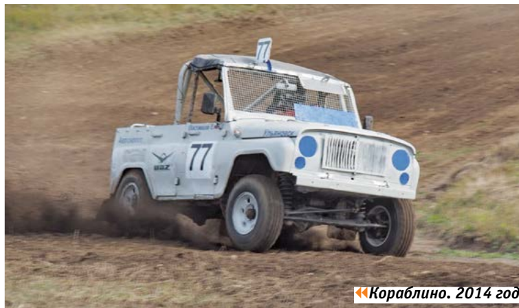
«Кораблино. 2014 год»