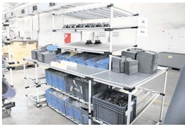
► Один из изготовленных многофункциональных столов-стеллажей

Решение: объединить подбороочные столы, сократить места складирования, исключить перетарку комплектующих и полуфабрикатов, исключить складирование на полу. Изготовить съемный кондуктор под подбор бачка ГУР без кронштейна.