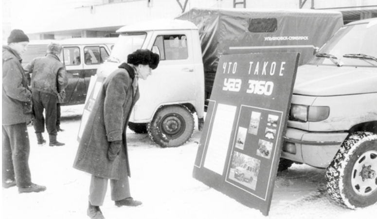
▶ Выставка автомобилей

Кузов базовой модели автомобиля УАЗ-3160 цельнометаллический, пятидверный типа «универсал». Для изготовления штампов была выбрана итальянская фирма «Фонтана». Привычными эмалями для уазиков были: защитная, песочная, серо-голубая. При изготовлении опытных партий 3160, специалисты УГК предложили использовать эмали новых оригиналь-