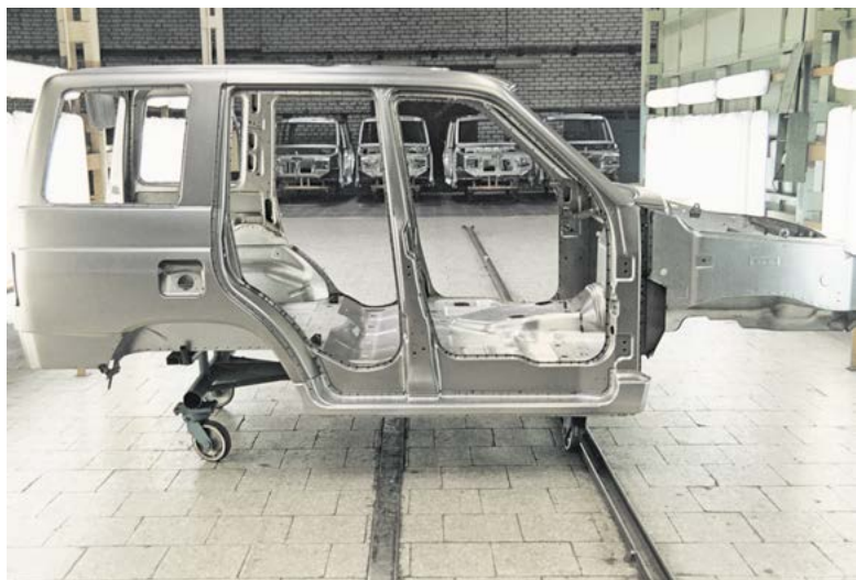
► Кузов УАЗ-3160

Первые опытные образцы, построенные на предприятии, на полигоне в Дмитрове в 1995 году легко разогнались до 140 км/час и сохраняли плавный ход. Об этом писали журналисты многих автомобильных изданий, так как появление нового автомобиля было очень интересной темой. В этом же году на российской выставке «Деловые связи» УАЗ-3160 вновь вызвал интерес у посетителей. Интересовала цена и когда можно будет приобрести этот чудо-автомобиль. Для тех, кто сомневался в том, что это не просто выставочный макет, УАЗ-3160 пришлось загнать на одну из лестниц павильона, чтобы продемонстрировать его способности.