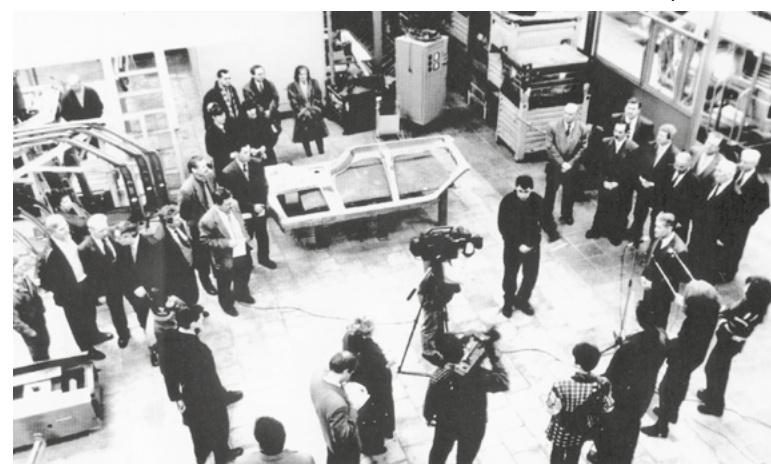
▶ Цех 3160 презентовали прессе в 1993 году.

ция была принципиально новой, оригинальная компоновка – агрегаты и узлы – иные, совершенно отличающийся кузов от привычных УАЗов. Как только не называли этот автомобиль: «суперджип», «дитя компромисса», «маленький бриллиант». Это было новое слово, большой шаг в отечественном автомобилестроении. Новый внедорожник в корне отличался от аутентичного, мощного, и немного напоминающего маленький танк УАЗ-469, за рулем которого вовсе не обязательно должен был сидеть военный. С постановкой на конвейер УАЗ-3160 автозавод перешел на изготовление, скажем так, мирных автомобилей с комфортом, для простых людей,