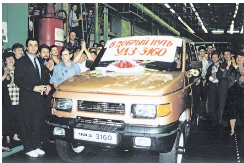
► Выпуск первого автомобиля УАЗ-3160 1997 г

Весь завод готовился к выпуску новой машины, на нее возлагались большие планы. Это был большой толчок для всего коллектива, появились надежда на лучшее и уверенность в завтрашнем дне.