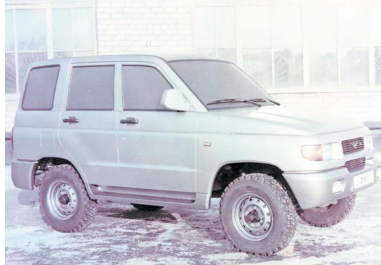
▶ Посадочный макет

Государство сильно сократило финансирование армии и сель-