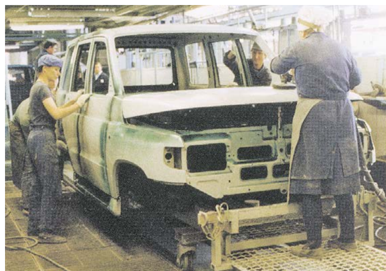
▶ Сборочно-кузовное производство

ных расцветок: МЛ-12, МЛ-1110, МЛ-197 и МЧ-145. В начале 1993 года в лаборатории лакокрасочных покрытий УГТ испытали 16 новых расцветок эмалей постав-