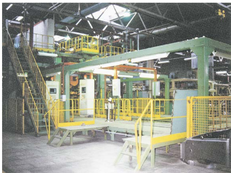
► Сварочная линия «КУКА»

новая линия имела возможность окрашивать также лобовую и заднюю часть кузова. Все это